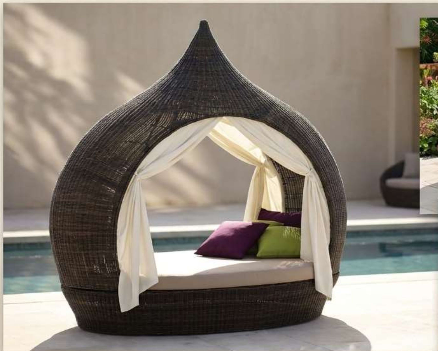
Le Sanctuaire Privé. Rideaux drapés et structure monumentale pour une intimité absolue au bord de la piscine.