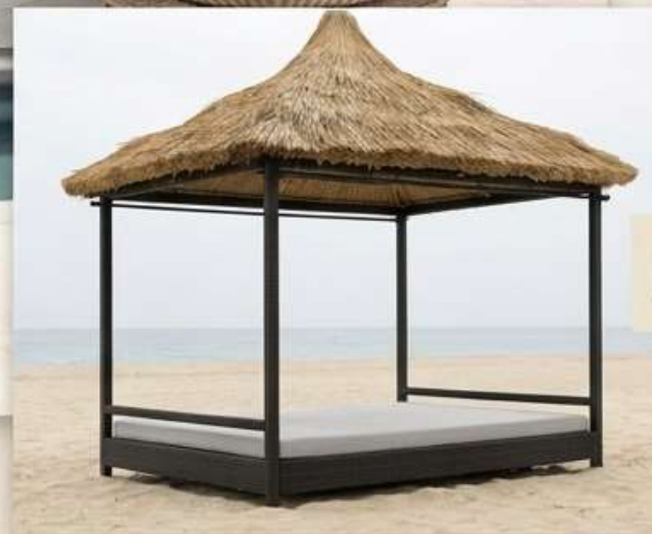
L'Esprit Resort classique.