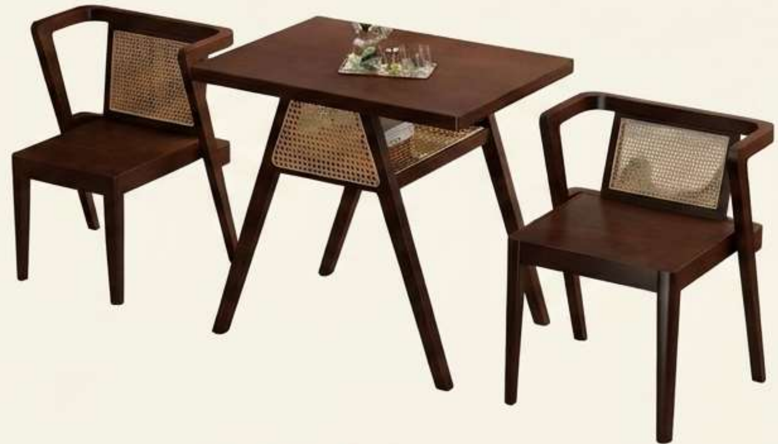
Noyer & Cannage.

L'esprit scandinave rencontre l'artisanat traditionnel. L'espace respire grâce à l'ajourage du dossier.