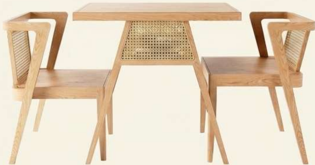
Chêne Clair & Cannage.

L'esprit scandinave rencontre l'artisanat traditionnel. L'espace respire grâce à l'ajourage du dossier.