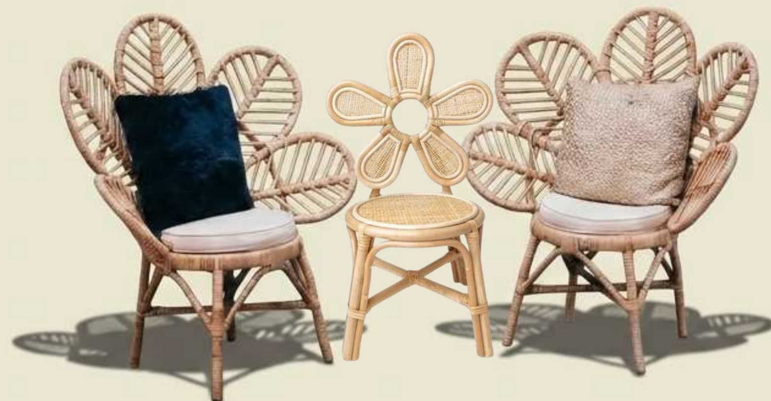
L'Écllosion Florale. Des courbes botaniques qui transforment une simple assise en véritable œuvre d'art sculpturale.