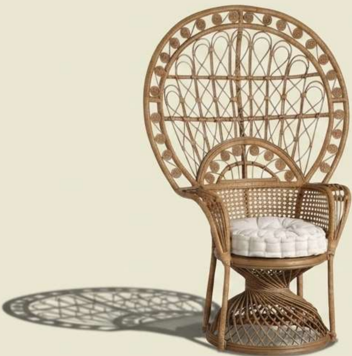
La Majesté du Paon. Un trône intemporel dont la dentelle de rotin filtre la lumière comme un vitrail naturel.